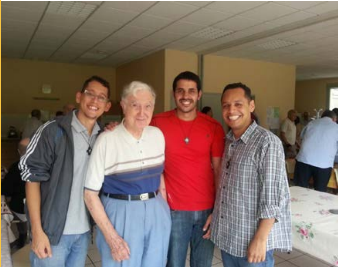
Encuentro de “Formandos Profesos” Francia 2015